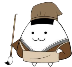
マスコットキャラクター むすぶくん