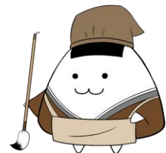
マスコットキャラクター むすぶくん